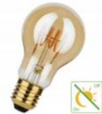
SPIRALED Détecteur Jour/Nuit A60 E27 4W (28W) 300lm 820 Or Numéro 145769