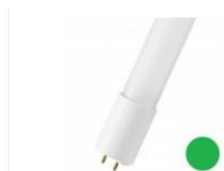
LED Party T8 1200 G13 18W (36W) Vert EM+AC Numéro 141894