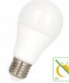
LED Ecoplus Détecteur Jour/Nuit A60 E27 9W (60W) 820lm 827 Numéro 145743