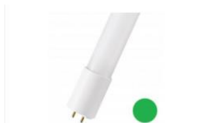
LED Party T8 600 G13 10W (18W) Vert EM+AC Numéro 141893

La couleur verte a été choisie comme le symbole parfait du repositionnement ces dernières années du groupe LEAG dans les énergies renouvelables.