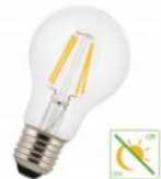
LED FIL Détecteur Jour/Nuit A60 E27 4W (35W) 400lm 827 Clair Numéro 141864

Également disponibles les lampes LED DAY & NIGHT , avec détecteur crépusculaire intégré