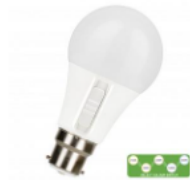
LED A60 Switch B22d DIM 8.5W (60W) 806lm 5CCT 2700K-6500K Numéro 145936

SWITCH B22 et E27 , on complète la gamme SWITCH avec 2 lampes LED avec la fonction CCT