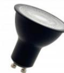
LED Spot PAR16 Noir GU10 DIM 6W (65W) 450lm 927 38D Numéro 146226