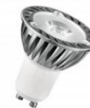
LED PAR16 GU10 230V 3W 25D Effet lumière noire Numéro 144502