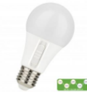
LED A60 Switch E27 DIM 8.5W (60W) 806lm 5CCT 2700K- 6500K Numéro 145935

Ajustez la teinte idéalement suivant l'environnement à éclairer ou l'atmosphère recherchée