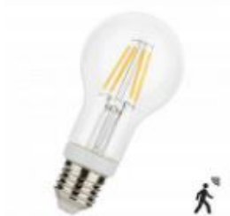
LED FIL Capteur de mouvement A60 E27 5W 600lm 827 Clair Numéro 145934

Détecteur radio-fréquence intégré Combinaison élégante avec lanternes, potelets ou appliques extérieures décoratives