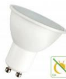
LED PAR16 Détecteur Jour/Nuit GU10 4.5W (35W) 250lm 827 120D Numéro 143854